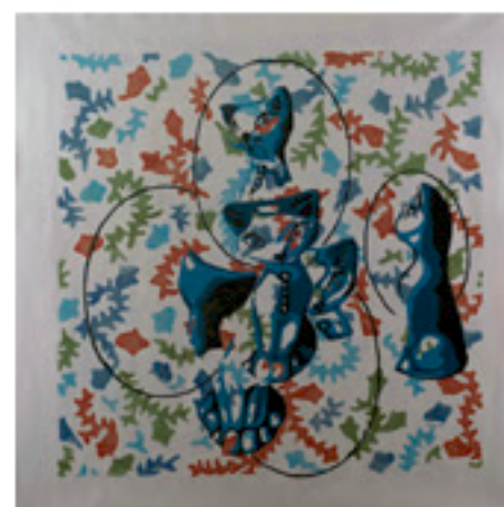
Transformaciones 14 | Acrílico sobre tela 90 x 90 cm.