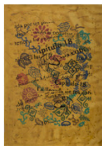
Transformaciones 10 | Acrílico sobre tela 124 x 84 cm.